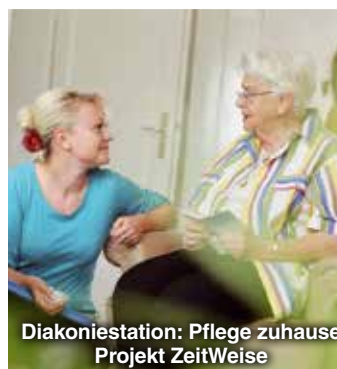
Diakoniestation: Pflege zuhause Projekt ZeitWeise