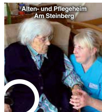
Alten- und Pflegeheim Am Steinberg