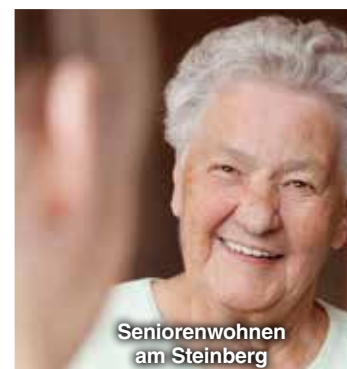
Seniorenwohnen am Steinberg

Diakonie Leine-Innerste – Diakonie in Ochtersum Wir sind für Sie da!