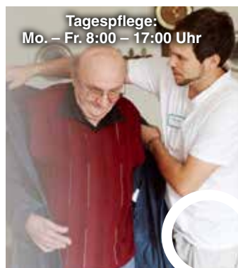
Tagespflege: Mo. – Fr. 8:00 – 17:00 Uhr